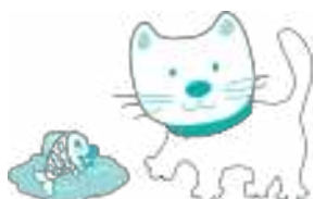
КОТИК ПОД МОСТОМ

Обыграйте чтение потешки — для этого используйте игрушечную кошечку и игрушечную рыбку. Если игрушки-рыбки нет, можно заранее вырезать из цветного картона фигурку рыбки.