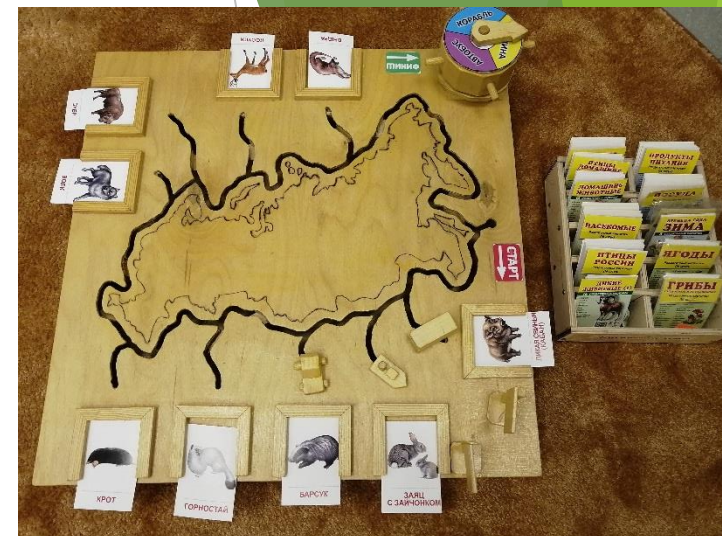
д\пособие «Путешествуй с нами»