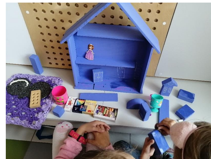
д\пособие «Лавандовый домик»