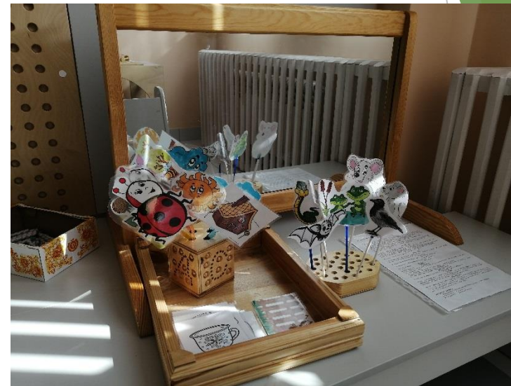
д\пособие «Театр на палочках»